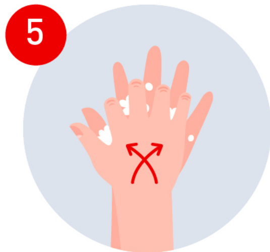
Talla entre tus dedos