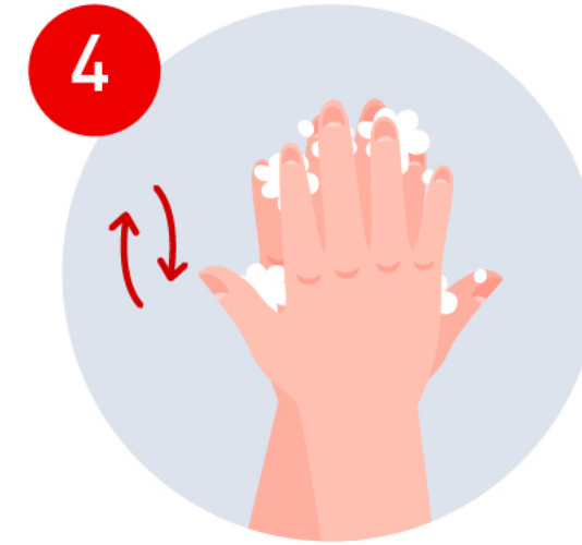
Enjabona el dorso de ambas manos