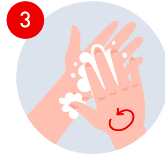
Frota tus manos palma con palma