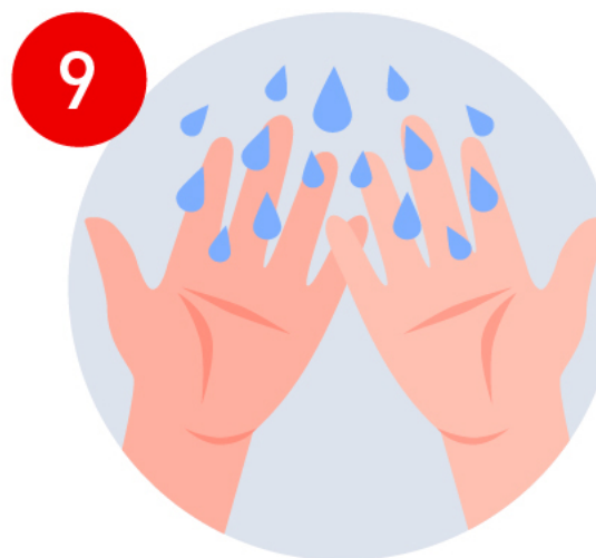
Enjuaga tus manos