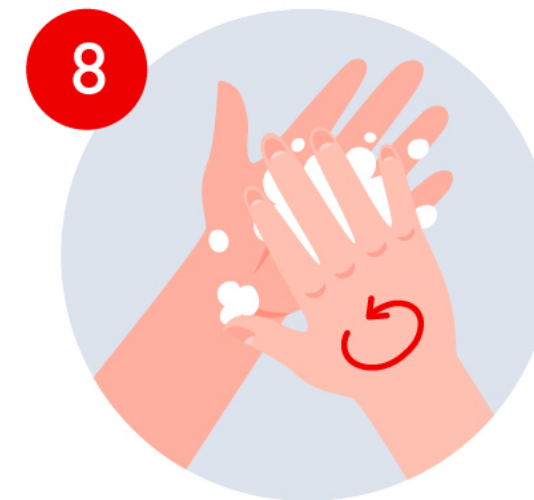
Lava tus uñas y la punta de tus dedos