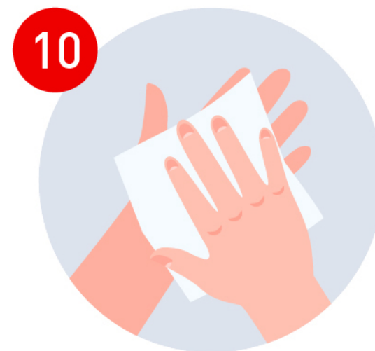
Seca tus manos con una toalla desechable