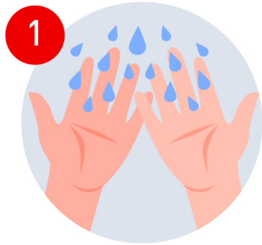
Moja tus manos