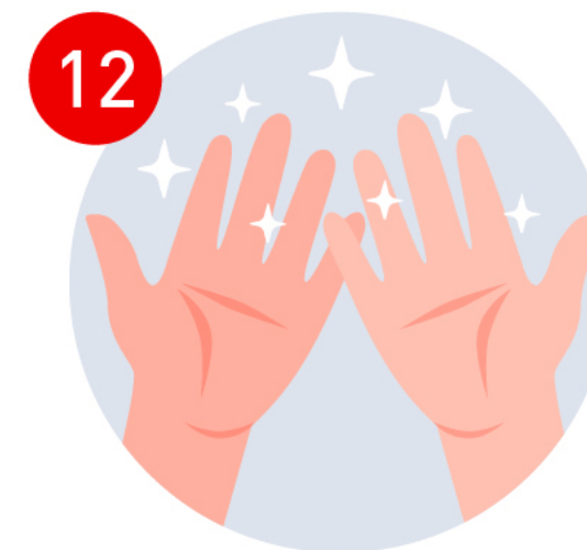
Tus manos están limpias