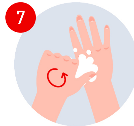
Lmpia tus pulgares