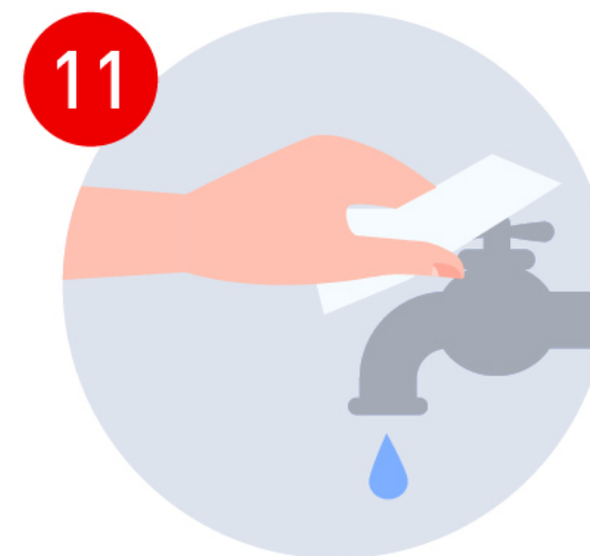
Usa la toalla para cerrar la llave